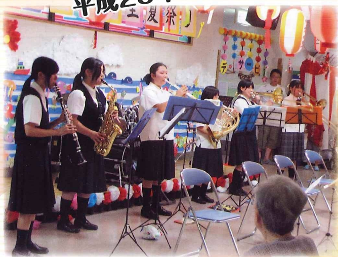
吹奏楽と三味線のコラボで ソーラン節