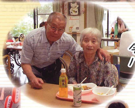
今日も仲よし ハイポーズ!