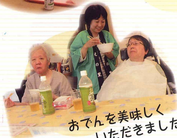
おでんを美味しく いただきました