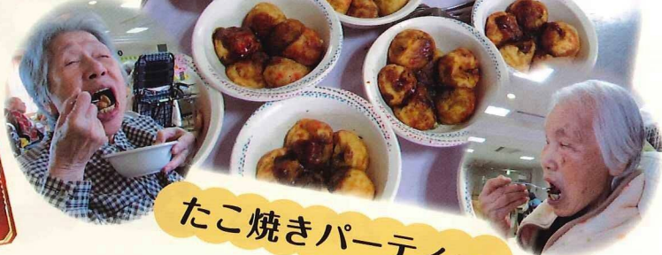
たこ焼きパーティー