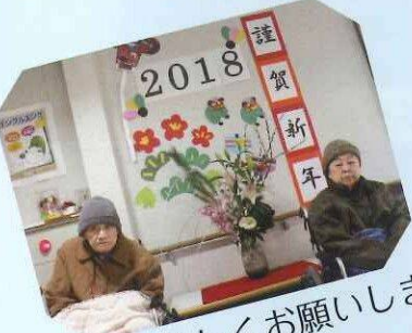
今年もよろしくお祈りします