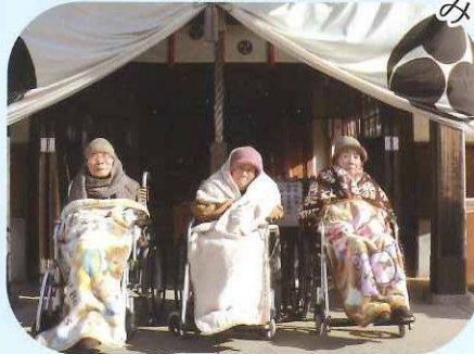
天気もよく穏やかなお正月になりました。