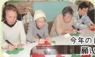
今年の目標や 願い事