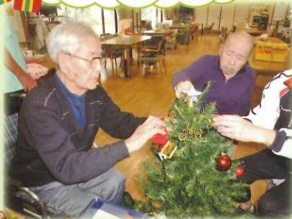
クリスマスの準備