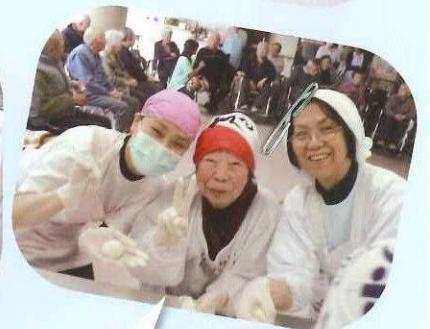
沢山おもちができました