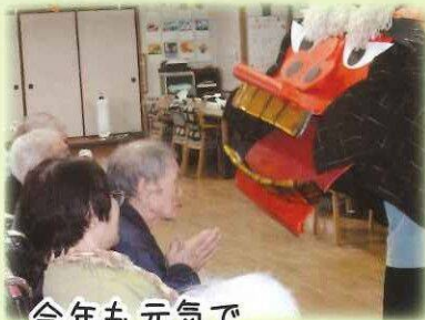
今年も元気で 過ごせますように