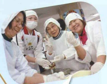
皆様と一緒に丸めましたよ