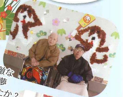
素敵な 初夢 みましたか？