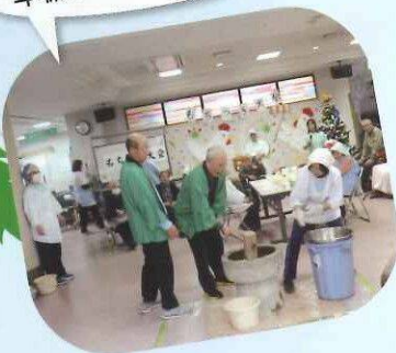
準備はいいですか？

毎年恒例、 デイサービスと ケアハウスと 特養合同で もちつき大会を しました。