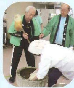
よいしょー！どっこいしょー