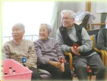
ハンドベルで合奏