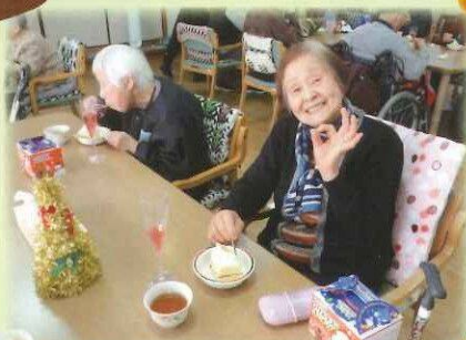
ケーキおいしかった♪