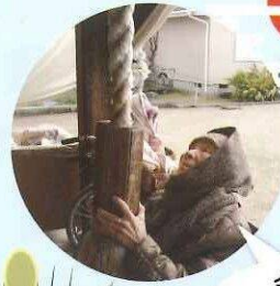
今年も健康で ありますように...