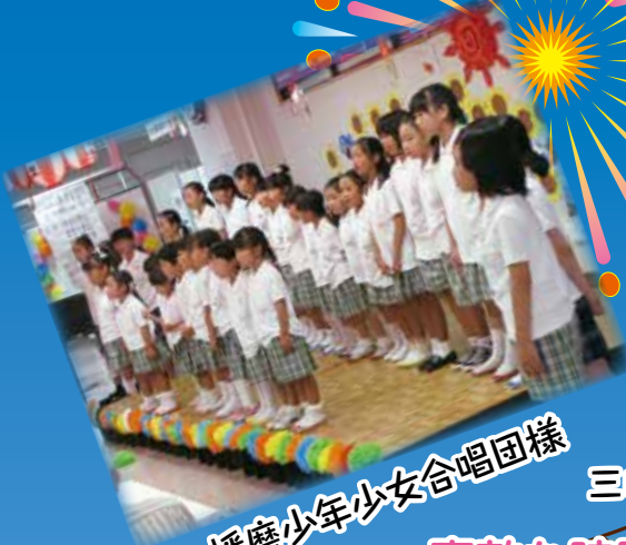
播磨少年少女合唱団様