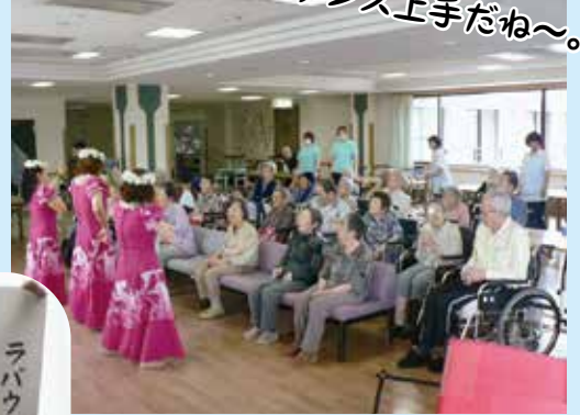
フラダンス上手だね〜。