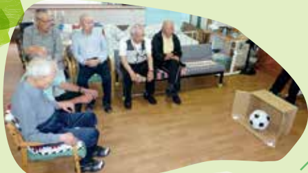
ビーチボールサッカー