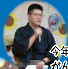
今年の司会者 がんばりました!