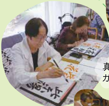
真剣に ガンバってます