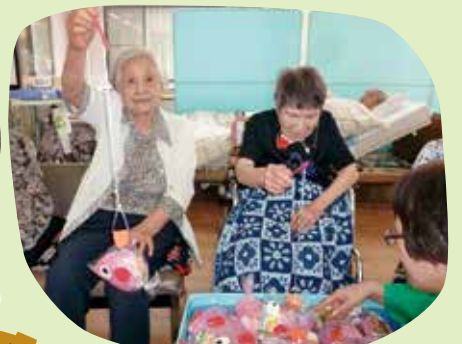
お菓子入り金魚釣り