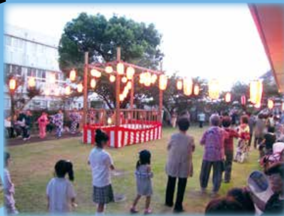
地域の皆様と楽しく盆踊り