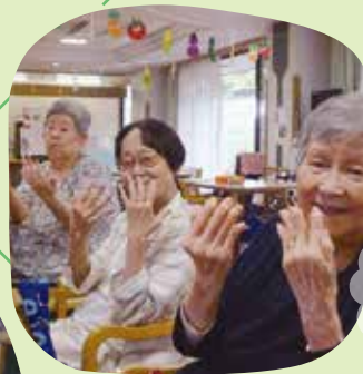
マニキュア塗って おしゃれしました