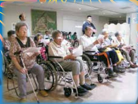
三味線にあわせて歌を歌いました