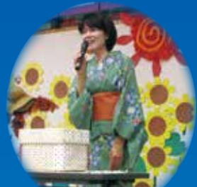
浅井施設長、初参加!!