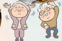
お一人お一人に 合った運動プログラム