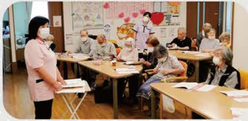
今日は何の授業かな？