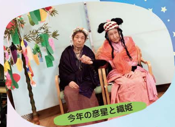
今年の彦星と織姫