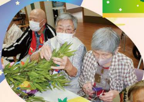
願いをこめて飾り付け！