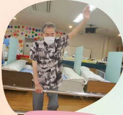
平行棒を使っ てのバランス