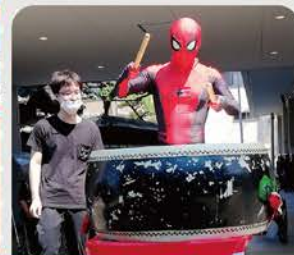
スパイダーマン登場で太鼓演奏に参加！