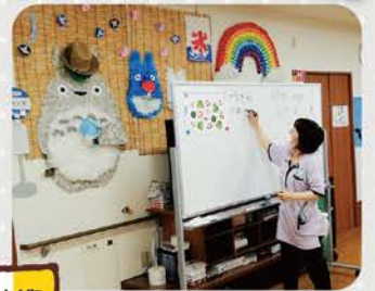
国語、算数はもちろん美術や家庭科もありますよ♡