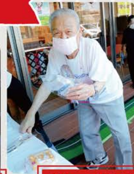
パターゴルフを楽しんだあとは景品ゲットです