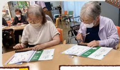
懐かしいそろばん