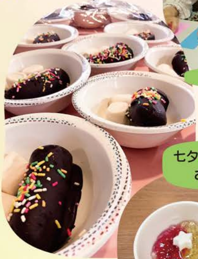
七夕の美味しいおやつ!!