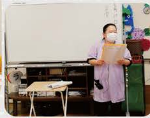
日替わりで職員が先生になります。