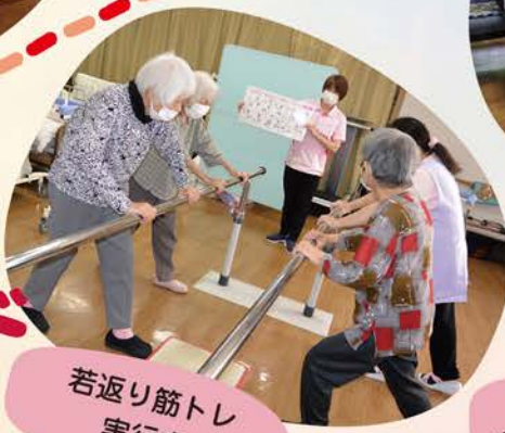
若返り筋トレ 実行中