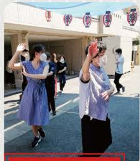
夏祭りと言えば盆踊り