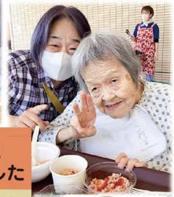
みんなの家・CoCo播磨と 合同で夏祭りを楽しみました