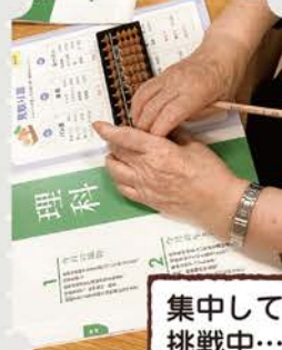
集中して見取り算に挑戦中…