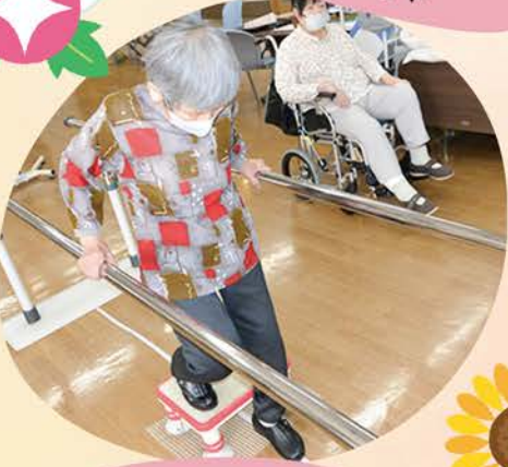
平行棒で運動し 下肢筋力UP