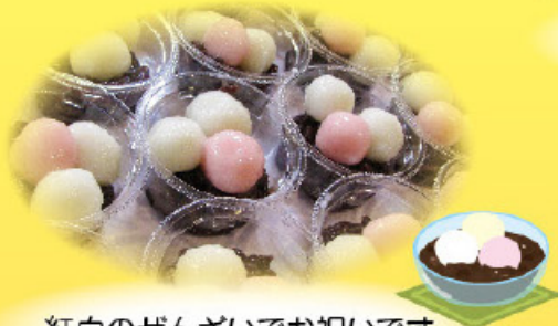
紅白のぜんざいでお祝いです