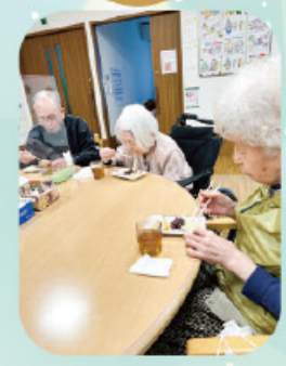
力強くついた お餅をみんなで丸めて、おいしくいただきました。