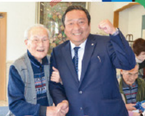
佐伯町長もかけて くださいました。