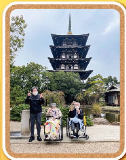
野添北公園まで来ましたよー。