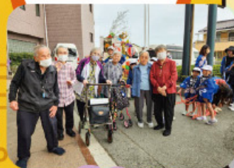
地域の秋祭りで、子どもみこしが来てくれました。