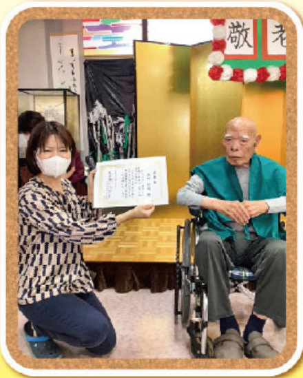
102才!! いつまでもお元気で…