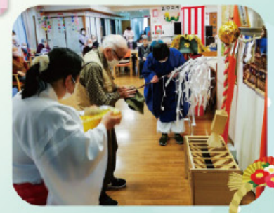
専用のお賽銭を入れてお祈願しています。