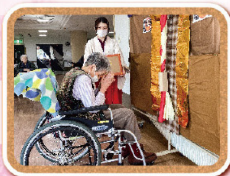
出張「阿笑神社」でお参り中