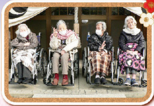
近くの住吉神社へ 初詣へ行きました。