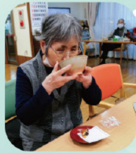
お抹茶とお茶菓子で一服中☆