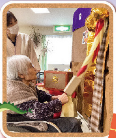
健康でありますように