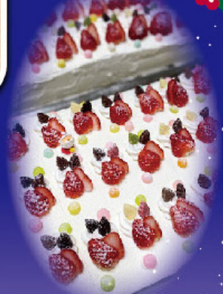
手づくりクリスマスケーキで 大満足!!