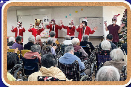
♪きよしのズンドコ節♪