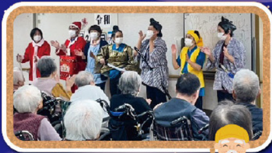
時代劇 水戸黄門 殺陣もお手の物です。