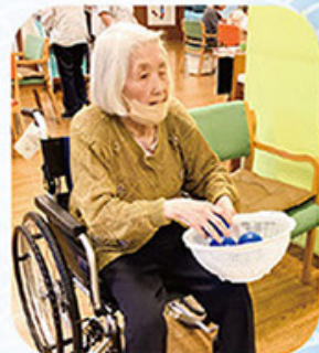
パーフェクトを目指します。