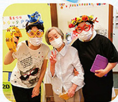
仮装した職員とピース!