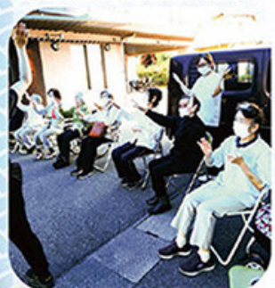
手拍子で盛り上げてくれました。