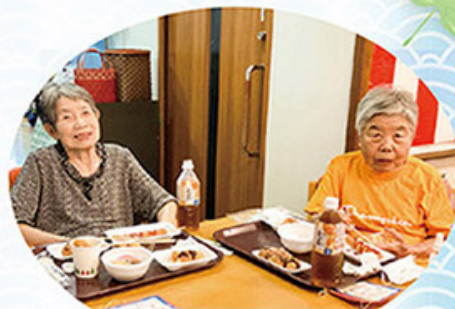
涼みながら 食事もしました。