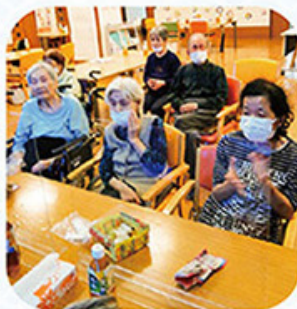
室内からもよく見えます。