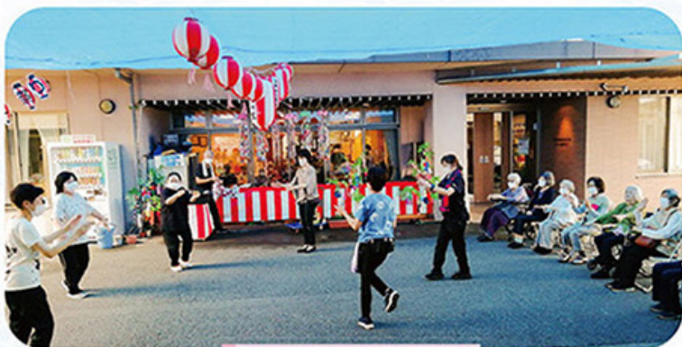
皆で円になって盆踊り